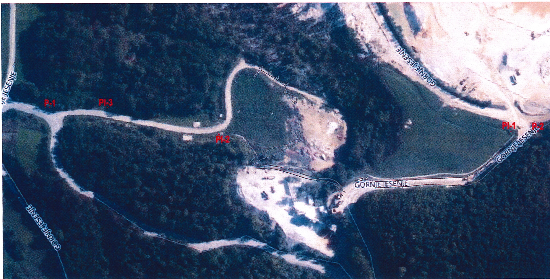
Prilog 2. Ortofoto s oznakama lokacija pijezometara i mjestima uzimanja uzoraka površinske vode

P-1, P-2 mjesto uzorkovanja vode iz potoka (nizvodno i uzvodno)